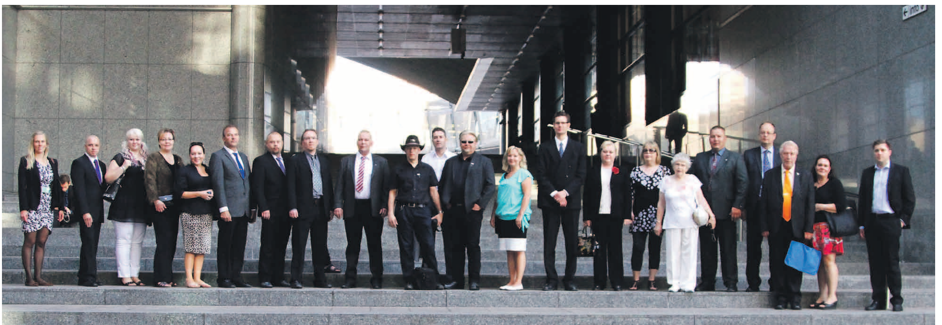
Joukko perussuomalaisia aktiiveja kävi tutustumassa Euroopan parlamenttiin Brysselissä. Opettavaisen ja mielenkiintoisen vierailun isäntänä toimi europarlamentaarikko Sampo Terho.