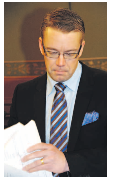
Stefan Wallin siirtyi pois puolustusministerin tehtävistä pelastettuaan ruotsinkielisen Dragsvikin varuskunnan lakkauttamislistalta.