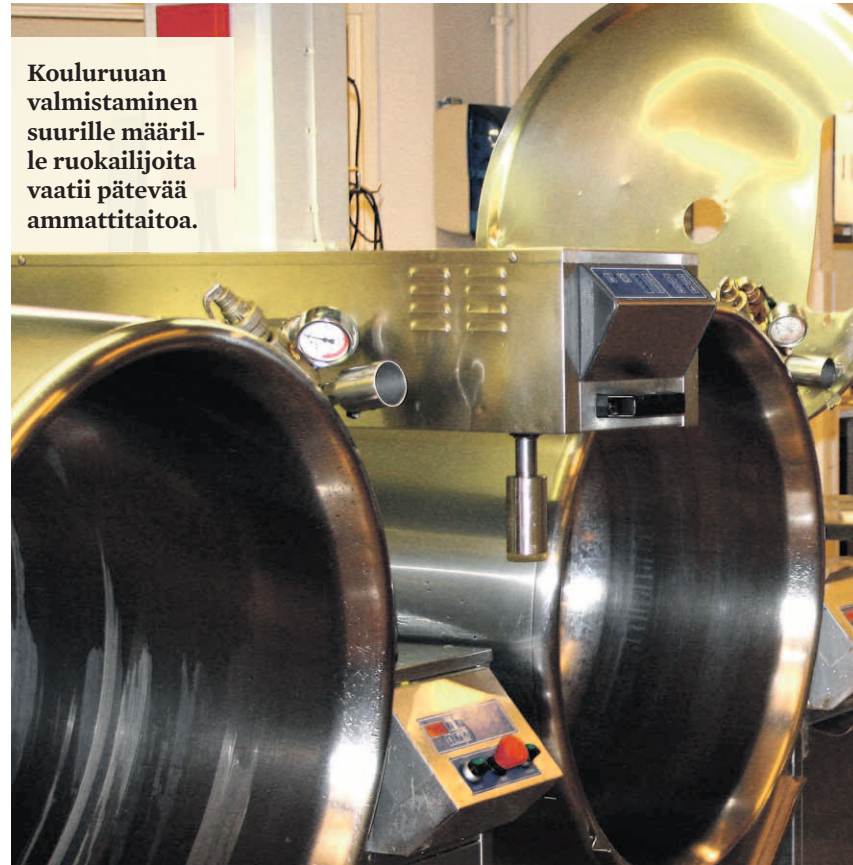
Kouluruuan valmistaminen suurille määrille ruokailijoita vaatii pätevää ammattitaitoa.

Huotarinen korostaa sitä, että kouluruokailu mielletään helposti velvollisuudeksi, vaikka sen perinteet ovat osa hienoa suomalaista hyvinvointia.