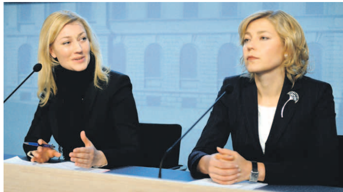
Maria Guzenina-Richardson joutui ministerikierrätykseen sekoiltuaan aikansa sote-uudistuksen kanssa. Kuntaministeri Henna Virkkuselle on jäänyt selittelijän rooli.