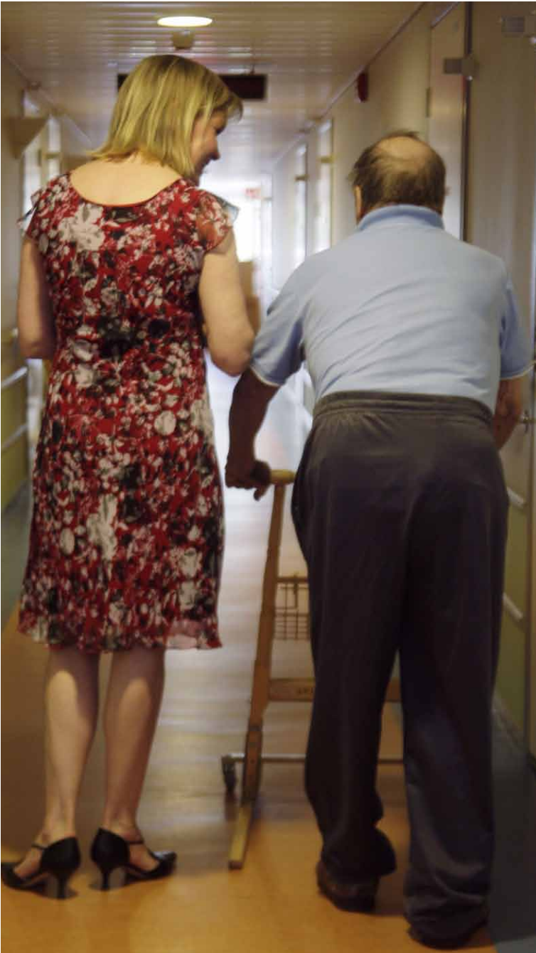
Päättäjät lupailevat kuntoutusta ja apua jokaiselle sotaveteraanille. Kuvassa veteraania kävelyttää Nuuskion Kuusikodin vapaaehtoinen työntekijä.