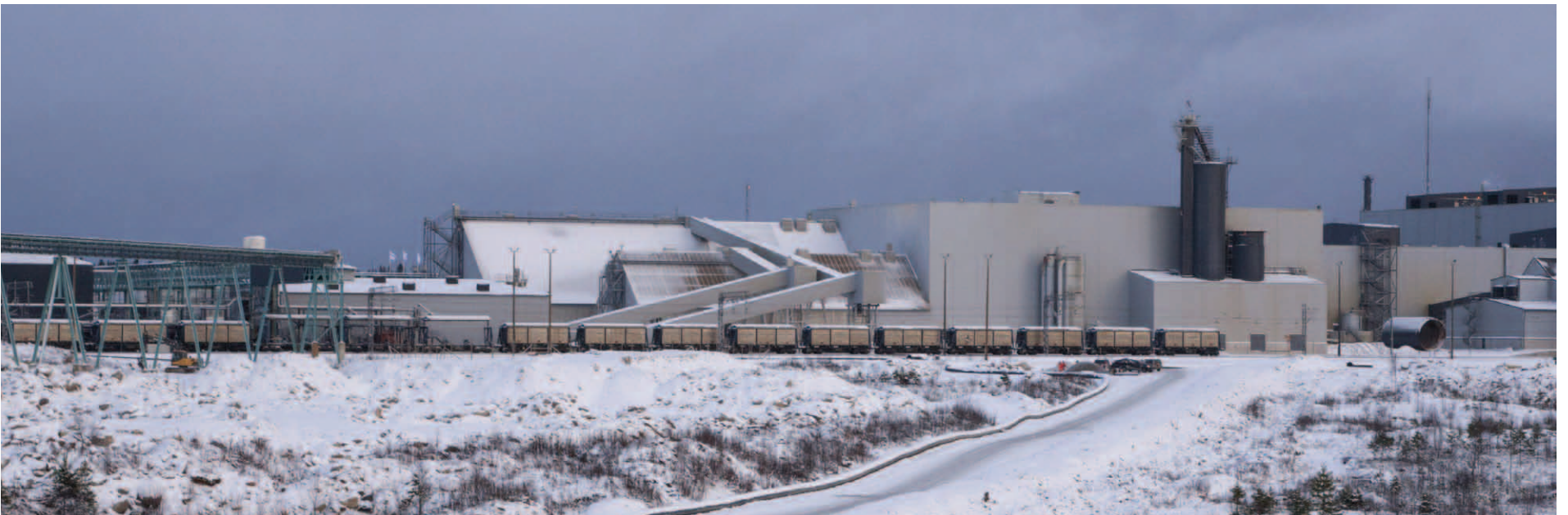
■ Teollisuutta ei saa kurittaa Talvivaarassa ilmenneiden ympäristöongelmien vuoksi.