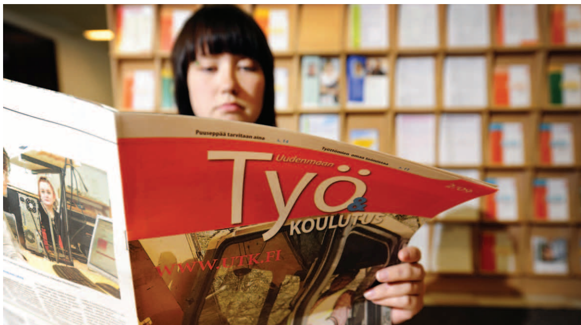
■ Työttömyys kasvaa tulevina vuosina, jos nykyistä alamäkeä ei pysäytetä.

matsissa kolmannessa erässä olisi 2 minuuttia jäljellä ja oltaisiin maalin tappiolla. Maalivahti pois ja kuudes kenttäpelaaja kaukaloon eli vero sekä maksurasitteita on tuntuvasti helpotettava vientiteollisuudelle loppuvaalikauden ajaksi. Samalla on valtion tehtävä sijoituksia ja irtisanouduttava sellaisista kansainvälisistä sitoumuksista, joilla suomalainen vientiteollisuus on ajautumassa huonompaan kilpailuasemaan kilpailijamaihin nähden.