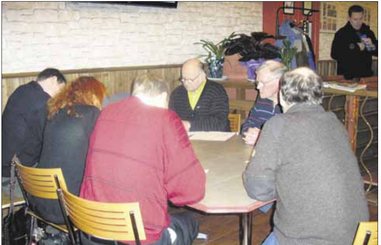
Kokemäen Perussuomalaisten perustava kokous onnistui yli odotusten. Paikalla oli 25 osallistujaa.

- Tehtävämme tulee olemaan puolueen toiminnan kehittäminen paikallistasolla. Lähiajan tavoite on saada kunnallisvaaleissa