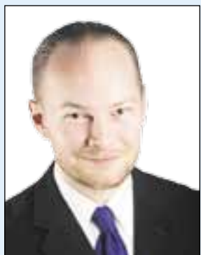
Sampo Terho europarlamentaarikko

Syvenevään eurokriisiin on etsitty ratkaisuja jo kaksi vuotta. Suurin osa esitetyistä ratkaisumal-