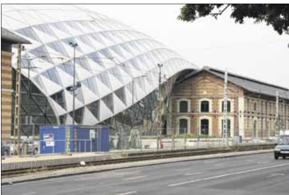
Budapestin arkkitehtuuri yllättää joskus.