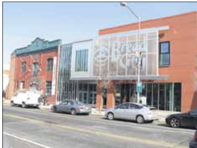
Bread for the Cityn julkisivu. Uusissa tiloissa on hyvä toimia.

Ohjelmaamme oli myös sisällytetty tutustuminen Washingtonissa toimivaan hyväntekeväisyysjärjestöön nimeltään Bread for the City. Tämä järjestö on perustettu jo vuonna 1974, kun kaupungin kirkkojen ruoka- ja vaateapu sekä Zachaeus Free Clinic yhdistyivät ja alkoivat jakaa apua Washingtonin vähävaraisille ihmisille. Tarpeet ovat kuitenkin laajentuneet ja