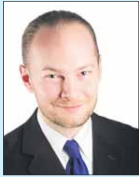
Sampo Terho europarlamentaarikko

EU-asiat tuntuvat kansalaisista kaukaisilta ja ovat uuvuttavan monimutkaisia, mutta ne vaikuttavat elämäämme, halusimme tai emme. EFD-ryhmämme puheenjohtaja Nigel Farage tiivisti asian elämänkerrassaan näin: ”Voi hyvänen aika, he eivät todella tiedä mitä heille täällä tehdään heidän omissa nimissään.”