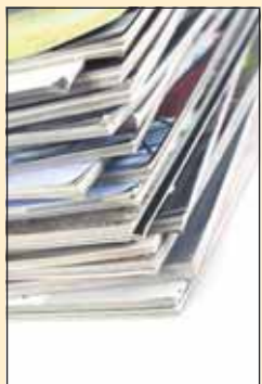
Aikakauslehdien irtonumero 50,50 mk