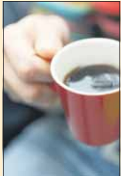
Kahvipaketti 27,40 mk

Suoraan markkoiksi muutettuina monien tuotteiden ja palveluiden hinnat näyttävät hurjilta. Alla satunnaisia poimintoja kaupungilta: