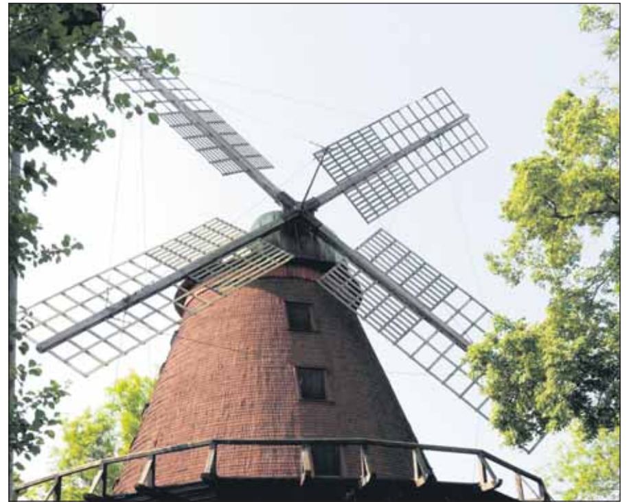
kuva Sappalinnan Kesäteatterin myllystä.

Perussuomalaisten Naisten sääntömääräinen kevätkokous pidetään lauantaina 16.7.2011 alkaen klo 13.00 Blu Marina Palace –hotellin kokoustilassa (Linnankatu 32, Turku). Käsitellään sääntöjen määräämät asiat.