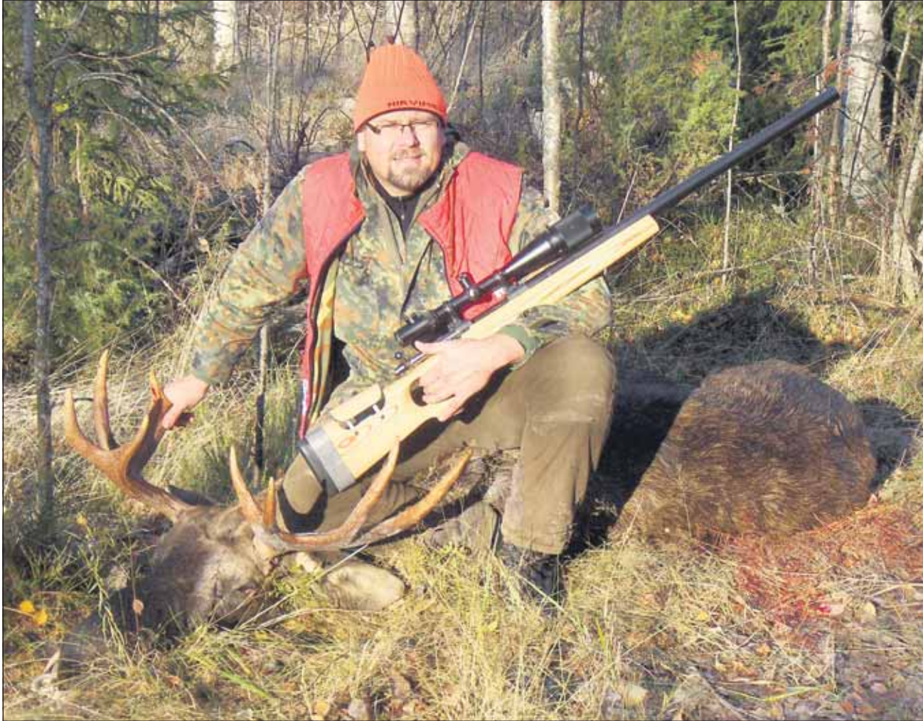
Metsästysmuisto vuodelta 2008.

Kiistelty aselakiuudistus hyväksyttiin eduskunnassa Perussuomalaisten tiukasta vastustuksesta huolimatta. Uudistus tuo muassaan monia muutoksia, joista suurin koskee aseiden hankkimiseksi tarvittavaa lupamenettelyä. Se muuttuu uuden lain myötä entistä monimutkaisemmaksi ja kalliimmaksi.