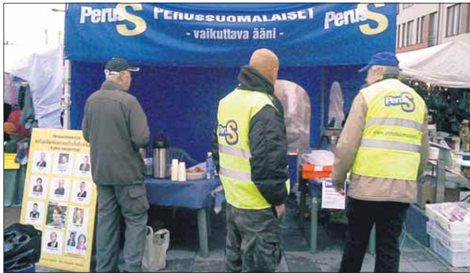
Perussuomalaiset kiilasivat jo Keskustankin ohi Kymen vaalipiirissä.

Neljännelle sijalle tipahtaneen Keskustan