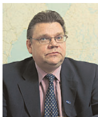
Puheenjohtaja Timo Soini

Nordea 218518-148703 Sampo 800013-70212996