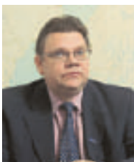
Puheenjohtaja Timo Soini

Nordea ..... 218518-148703 Sampo ..... 800013-70212996