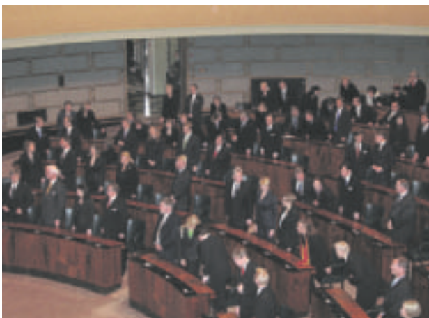
Kansanedustajat ovat löytäneet paikkansa.