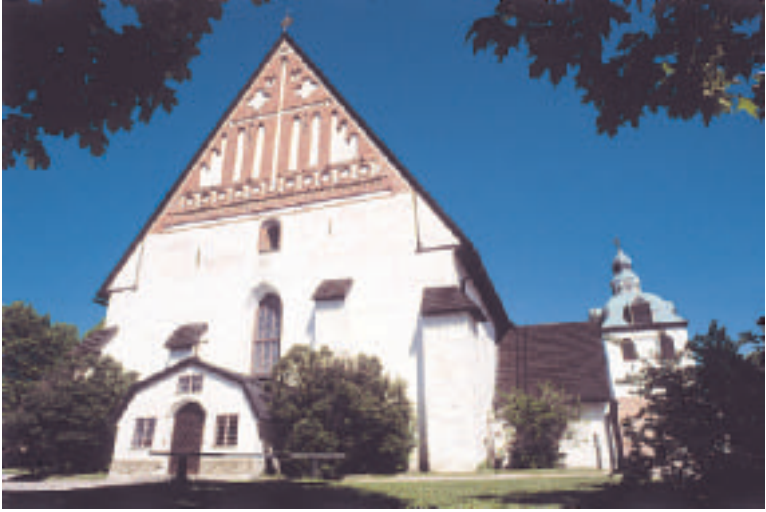
Naispappuus kuohuttaa kirkon piirejä.