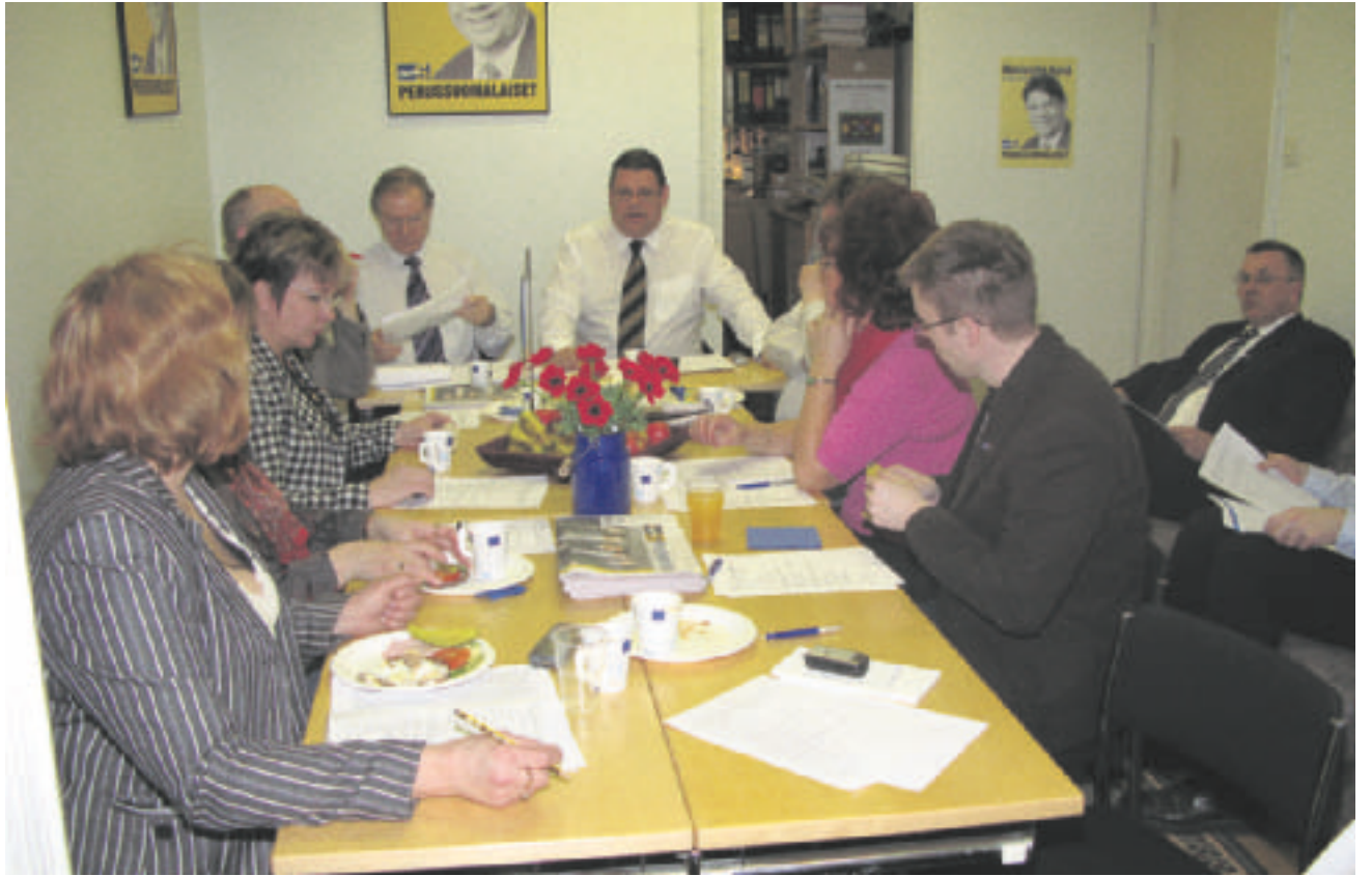
Puoluehallituksen kokous sujui leppoisasti.