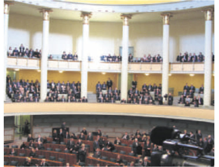
Lehtereillä oli tungosta valtiopäivien avajaisissa.