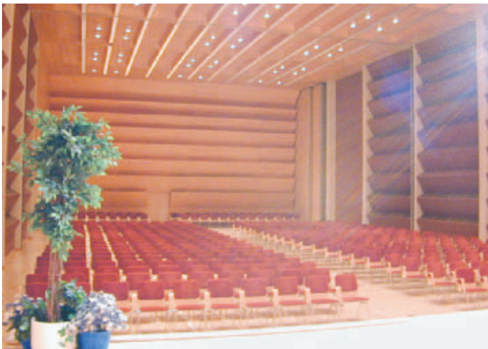
Tähän olemme päässeet: Kauppaoppilaitoksen Snellman-salissa os.Vingenkatu 8 Kokkola. Kymmenen vuotta myöhemmin kokoontumme yhteiseen juhlaan Kokkolaan paikkana juhlaava, suuri ja huippunykyaikainen Snellman-sali. Teemme tärkeitä henkilövalintoja ja linjaamme poliittista suuntaa mistä olemme aloittaneet ja mihin tulleet.