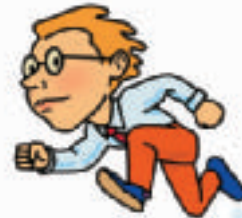
Presidentinvaalikipailu alkaa toden teolla vasta syksyllä.

Suurimmalla äänimäärällä ei silti aina voittajaksi päästä, vaikka voitetaankin kilpailu. Näin sanoo myös vanha roomalaiskatolinen laskuopin taitaja.