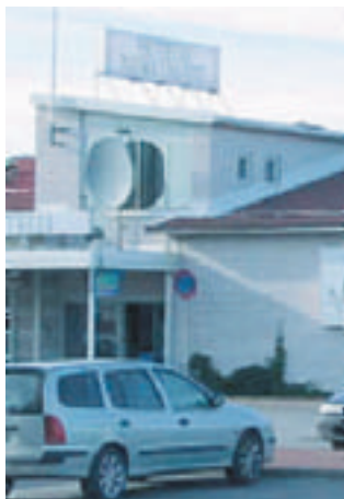
Paikka on edullinen ja viihtyisä

Hotelli Nukkumatista. Rautatienkatu 10, on varattu tilaa ja huone kuin huone maksaa 50 euroa. Tiloja on 1-3 hengelle/huone.