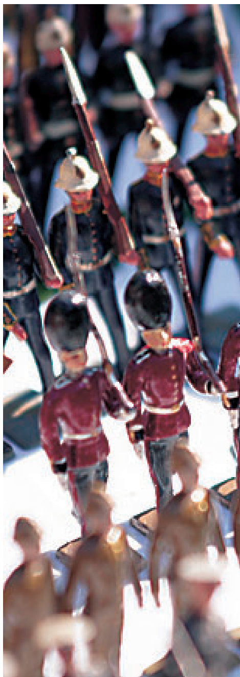
Jalkaväkeä tarvitaan Suomessa.