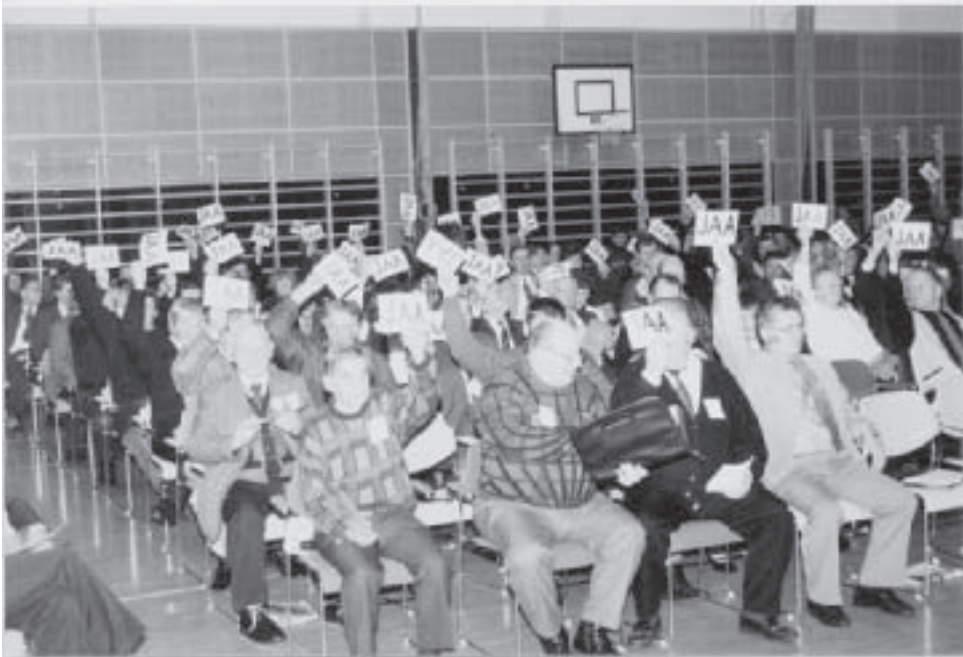
Tästä on 10 vuotta aikaa. 25.11.1995 Kokkolan Sairaanhoidon oppilaitoksen juhlasalissa perustettiin Perussuomalaiset-Sannfinländarna puolue ja hyväksyttiin yhdistysrekisteriin 16.6.1995.