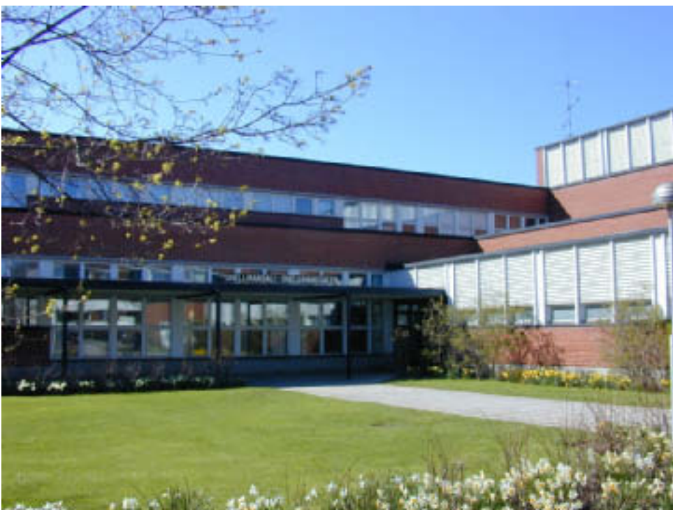
Paikalle löydät helposti opasteita seuraamalla Kokkolan Kauppaoppilaitoksen tiloihin Snellman-saliin.