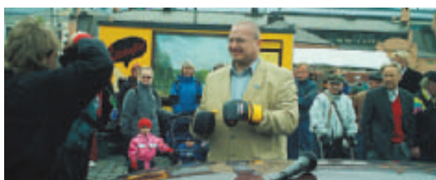
Kuopion torilla oli tiivis tunnelma