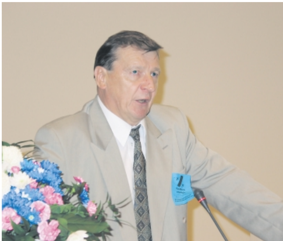
PerusS:n eduskuntaryhmän puheenjohtaja, kansanedustaja Raimo Vistbacka piti PerusS:n ryhmäpuheenvuoron eduskunnan käsitellessä 26.11.2003 lähetekeskustelussa asiaa: Valtioneuvoston selonteko julkisuuslainsäädännön kokonaisuudistuksen täytäntöönpanosta.

Kansalaisten oikeus ja mahdollisuus saada viranomais- taholta tietoa heitä itseään koskevista asioista ja tiedoista on kansanvallan kannalta erittäin merkittävä asia, sillä kansalaisia koskevia tietoja rekisteröivät lukuisat niin valtion kuin kuntienkin viranomaistahot kuin myös erilaiset muut rekisterejä ja arkistoja ylläpitävät laitokset. Ennen vuonna 1998 hyväksytyä uutta julkisuuslainsäädäntöä voimassa ollut asiakirjajulkisuuslaki johti varsin kirjavaan ja hajanaiseen käytäntöön, joka usein johti viranomais- tahosta riippuen kirjaviin tulkintoihin asiakirjan julkisuudesta. Kuvaavaa onkin, että nyt tarkastelussa oleva julkisuuslaki johti yli 120:n eri säädöksiin sisältyneen salassapitosäännöksen kumoamiseen. Näin ollen 1. päivänä joulukuuta 1999 voimaan tullut julkisuuslainsäädäntö oli tarpeellinen ja tervetullut lakiuudistus.