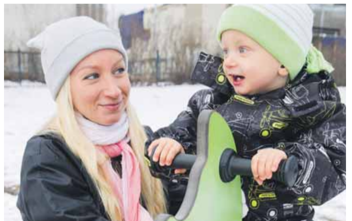
Minnin poika on 11-vuotias, tyttö on yhdeksän ja nuorimmainen täyttää elokuussa kaksi. Vatsa-asukki syntyy vuoden lopussa.

- Uskoisin, että jokainen nainen, joka on ollut pitkään kotona, haluaisi palata töihin, mutta senkin pitäisi olla perheen oma päätös. Valtion ja kunnan pitäisi tukea tällaista mallia.