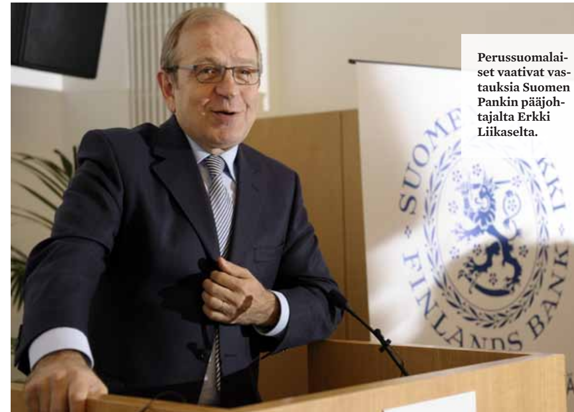
Perussuomalaiset vaativat vastauksia Suomen Pankin pääjohtajalta Erkki Liikelta.

sia sopimuksia esimerkiksi eurokiirsin hoidon tulevaisuuden askelmerkeistä, Saarakkala täsmentää. Hänen mukaansa olisi tarkoituksenmukaista, että kokoukseen osallistuvan valtioneuvoston edustaja esittäisi eduskunnassa selvityksen seminaarin sisällöstä että tehdyistä poliittisista päätöksistä. Saarakkala on tehnyt asiasta kirjallisen kysymyksen.