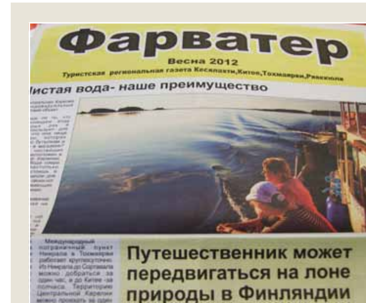
Seudun arjesta vieraalla kielellä. Keski-Karjalan kuntien yhteinen elinkeinoyhtiö on tehnyt vuodesta 2011 lähtien Väylä-lehteä venäjänkielisille lukijoille yhteistyössä paikallislehden kanssa.