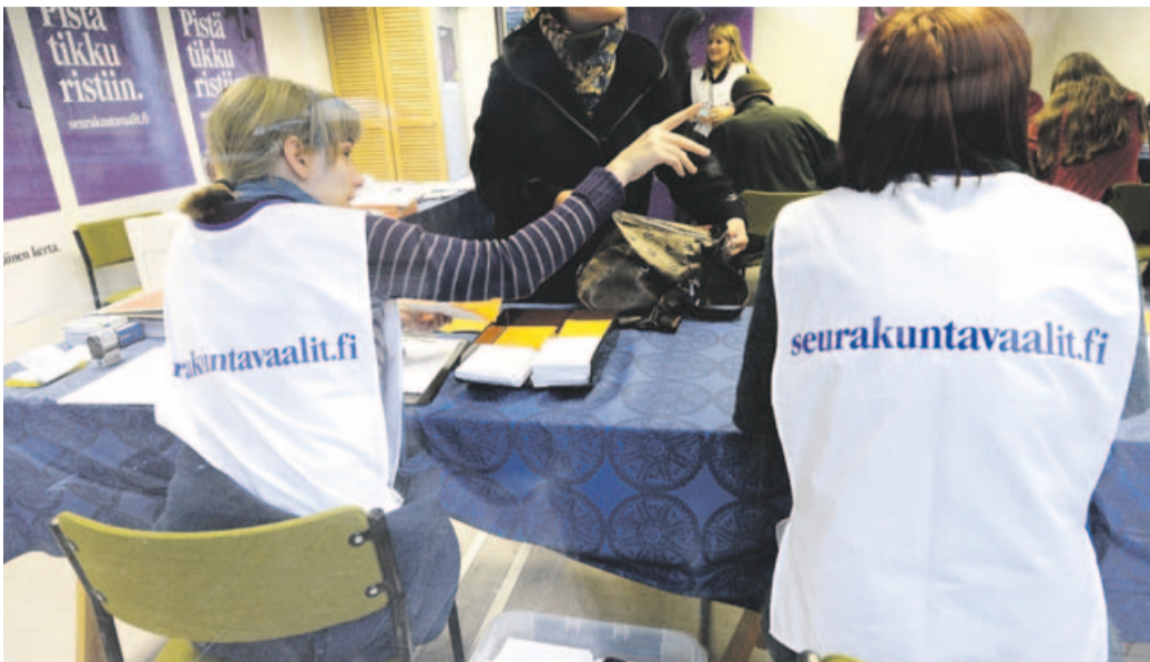
Perussuomalaisia ehdokkaita tarvitaan myös seurakuntavaaleihin.