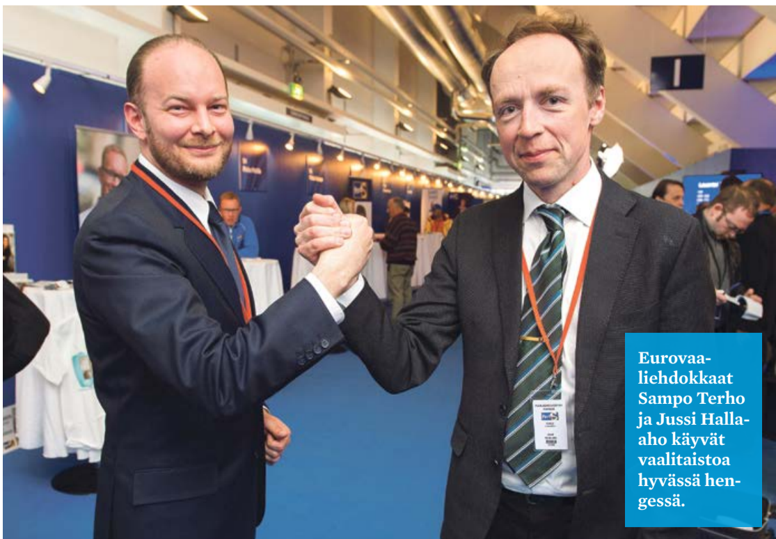
Eurovaaliehdokkaat Sampo Terho ja Jussi Halla-aho käyvät vaalitaistoa hyvässä hengessä.