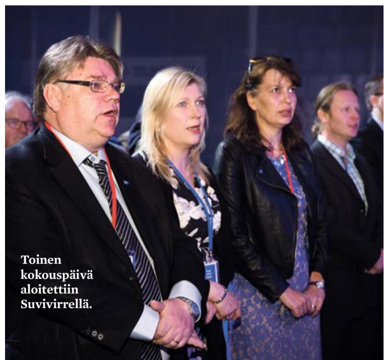
Toinen kokouspäivä aloitettiin Suvivirrellä.