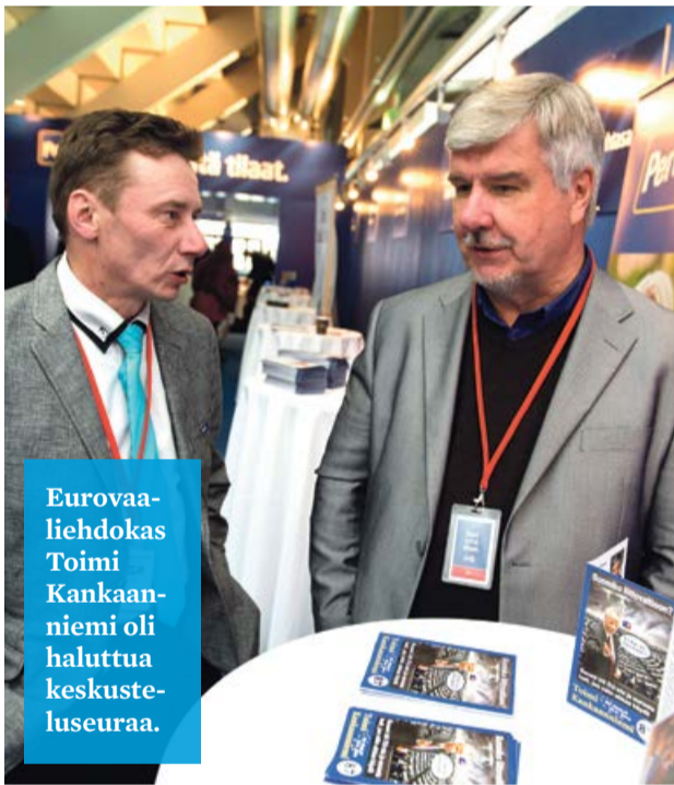
Eurovaaliehdokas Toimi Kankaanniemi oli haluttua keskusteluseuraa.