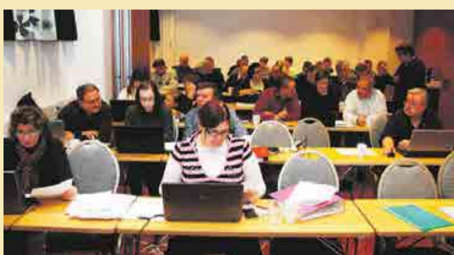
Puoluetuomiston ja piirijärjestöjen koulutustilaisuuksista on tullut suosittuja.