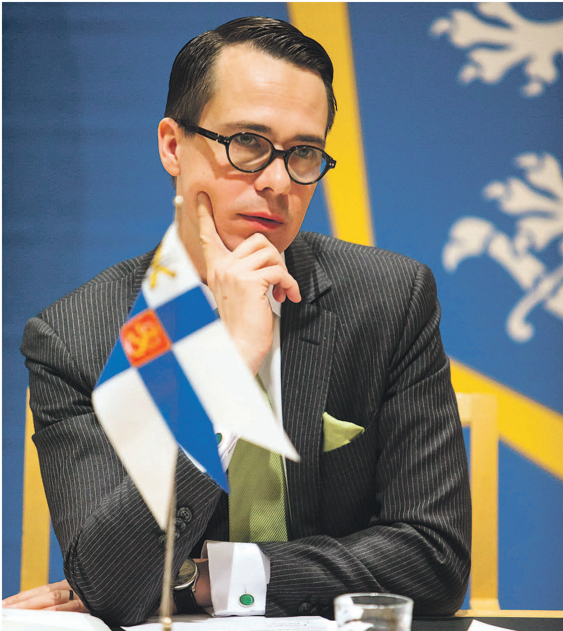
■ Ministeri Carl Haglundin selitykset eivät vakuuta kaikkia.